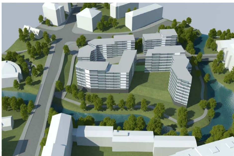
Sett fra sørøst

Bebyggelsen legges 20 meter fra elven. Det legges opp til 20 % uteareal i forhold til bolig BRA. 60 % av utearealet vil ligge på bakken.