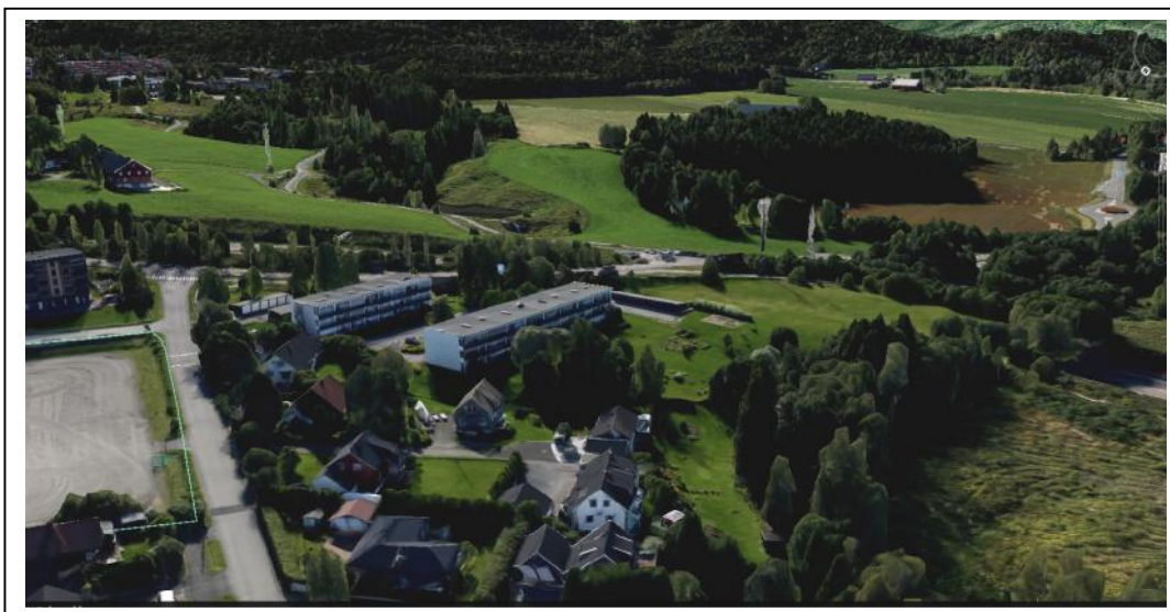
Illustrasjon 2: Skråfoto av eksisterende situasjon 81/95 sett fra vest og nordvest.