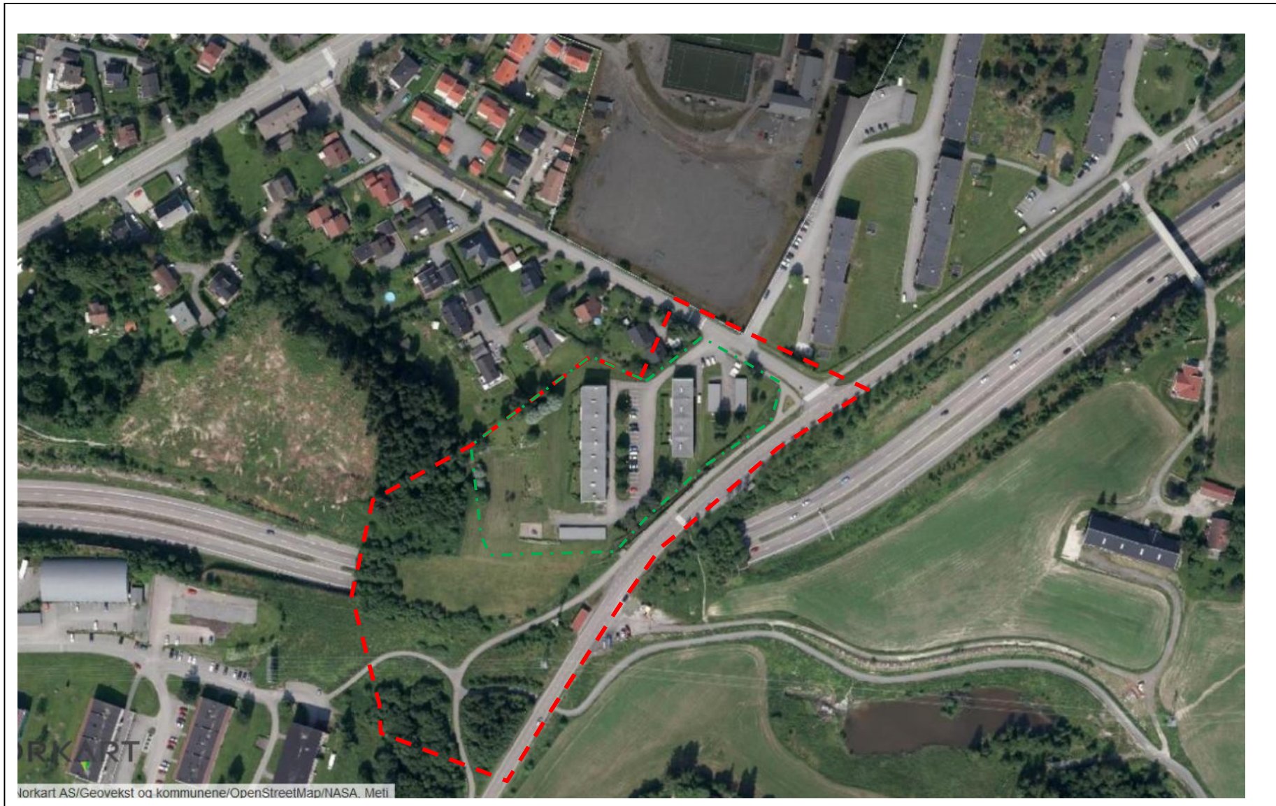
Illustrasjon 1: Flyfoto over planområdet (rød avgrensning), eiendom 81/95 (grønn avgrensning) og tilleggende nærområde.