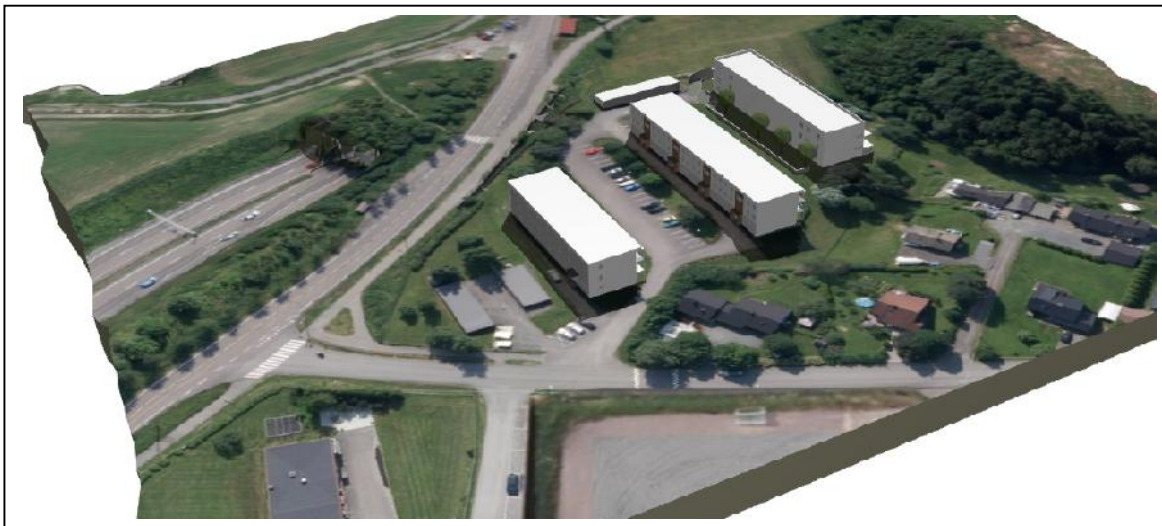
Illustrasjon 4: Perspektiv/volumstudie av mulig boligfortetting i vestre del av eiendom 81/95, sett fra sørvest og nordøst