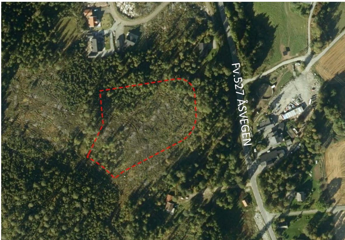
Flyfoto av planområdet (før påbegynt graving/grunnarbeider). Planområdet er vist med stiptet strek.

Det går en rekke bussruter langs fv.527 Åsvegen, med Ramstad som nærmeste holdeplass. Bussene går mot Nannestad/Lillestrøm.