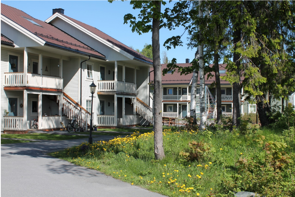
Eksempel på ønsket hustype