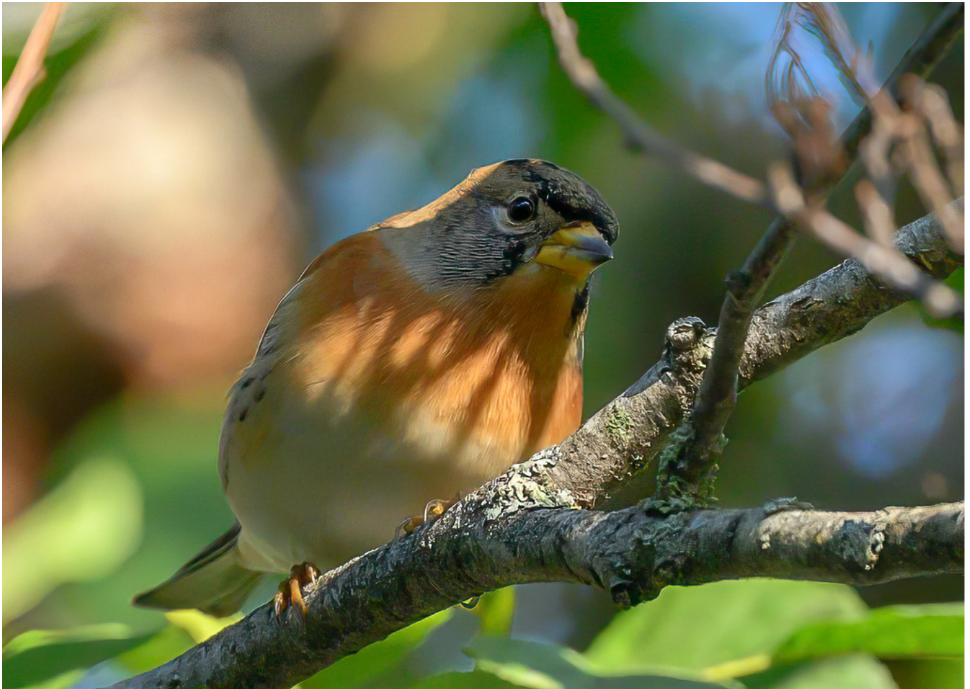
Bjørkefink ved Akerselva