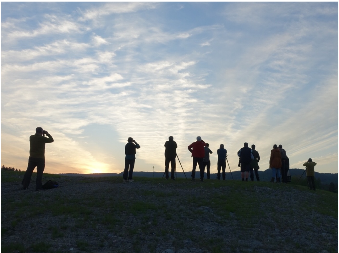
Fra kommunefugl- og nattsangertur i Nittedal 04.06.2021