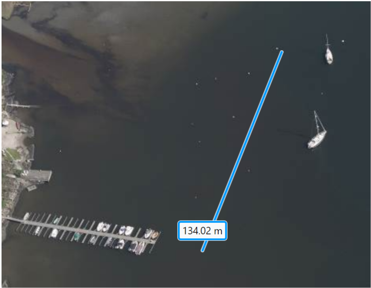
Flyfoto fra 2019. Her dokumenteres over 10 fortøyningsbøyer mindre enn 150 meter fra omsøkt brygge.