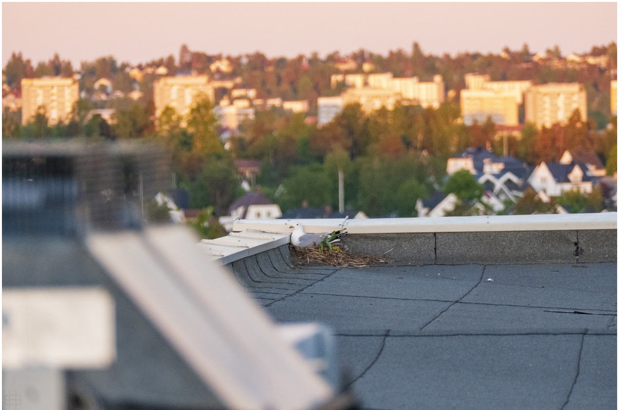
Takhekkende fiskemåker foretrekker å bygge reiret i et hjørne, slik at de får 270 grader oversikt. Her fra kontroll 01.06.2020.