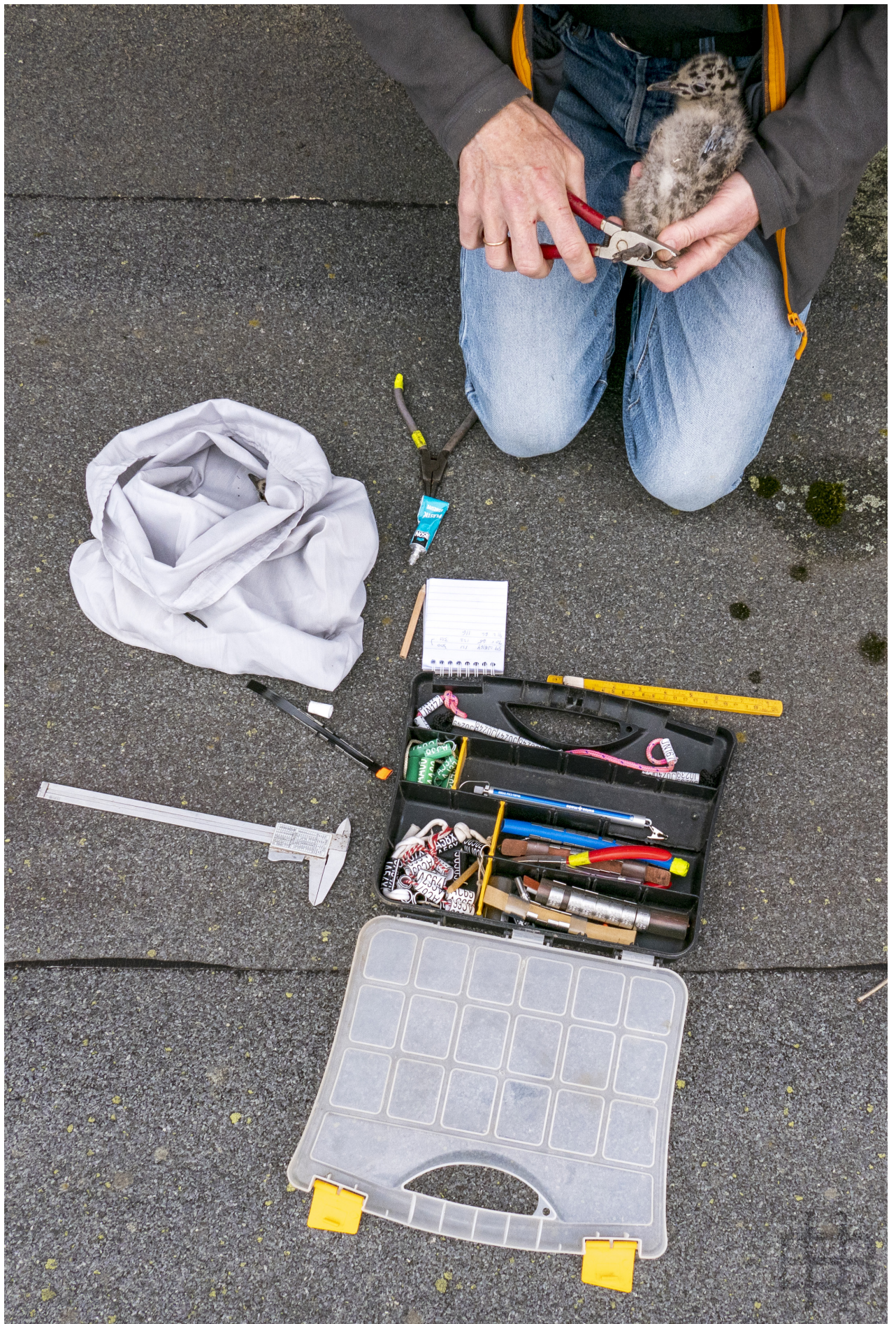
Carsten Lome med ringmerkings- og måleutstyr fra merkinga i 2021.