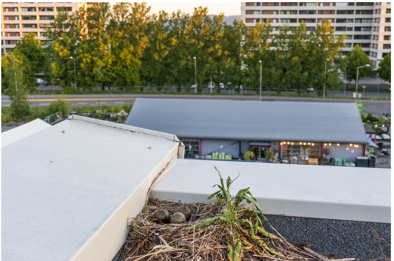
Reir 2 fra kontroll 01.06.2020. Egget bakerst til høyre viser små sprekker, og dette er klekkedatoen for kullet.