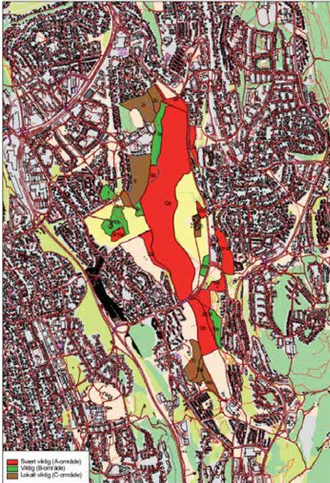
Figur 2. Østensjøområdet miljøpark. Oversikt over de 30 del-områdene som Miljøparken er delt inn i

Østensjøområdet miljøpark fra 2007. Planen inneholder flere delområder i kategorien «Svært viktig» utover de som er vist i det aktuelle forslaget i 2024.