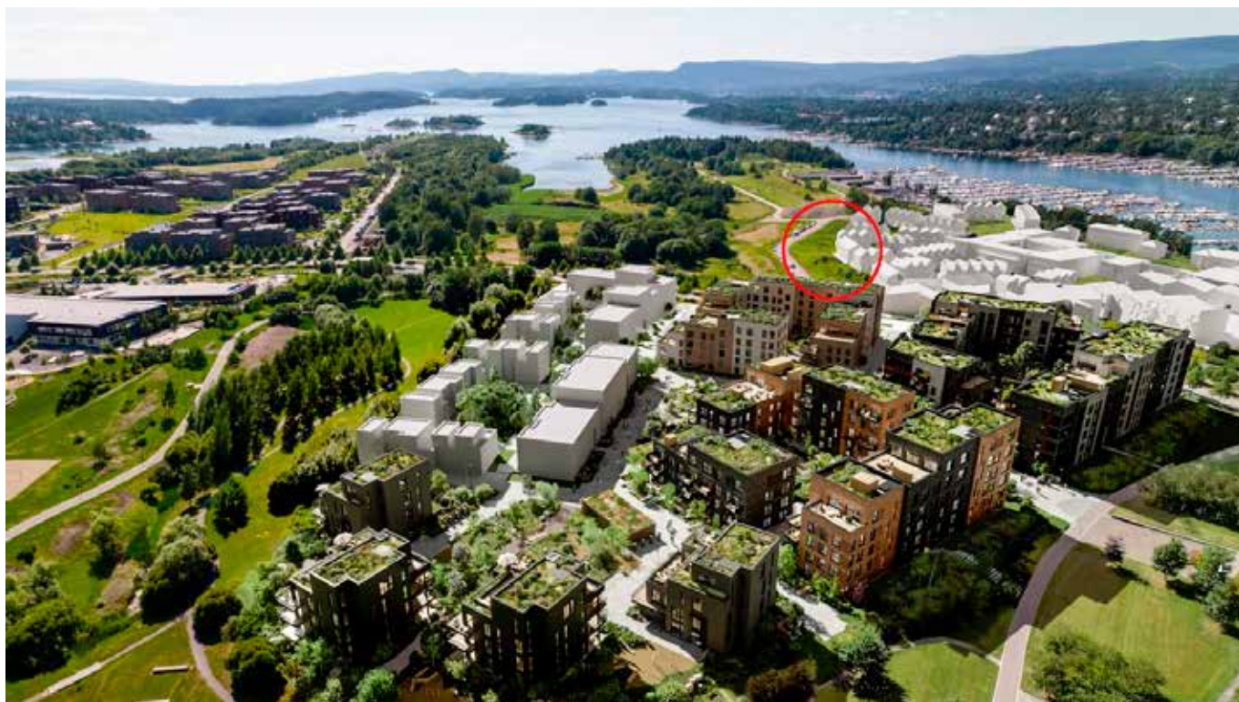
Slik presenterte Obos prosjektet opprinnelig. Det aktuelle området er sirklet inn med rødt av oss. Merk lave bygg og god avstand til Tornsangerveien og Storøykilen naturreservat.

I den vedtatte planen er utnyttelsesgraden økt radikalt. Byggene er trukket nesten helt ut til Tornsangerveien, høyden på nybyggene er her nesten tredoblet, og flate tak og takterrasser skal være tillatt. Dette vil resultere i at de nye leilighetsbyggene vil ruve over naturområdene i Storøykilen og redusere naturverdiene her. Takterrasser og balkonger i denne retningen vil bidra til økt støy og forstyrrelse mot naturområdene. Når det gjelder bolighøyden og -plasseringene i den vedtatte planen argumenteres det utelukkende med hensynet til de kulturhistoriske verdiene i eksisterende bygningsmasse ved Oksenøya bruk – og ikke til de minst like store naturverdiene i det tilstøtende området.